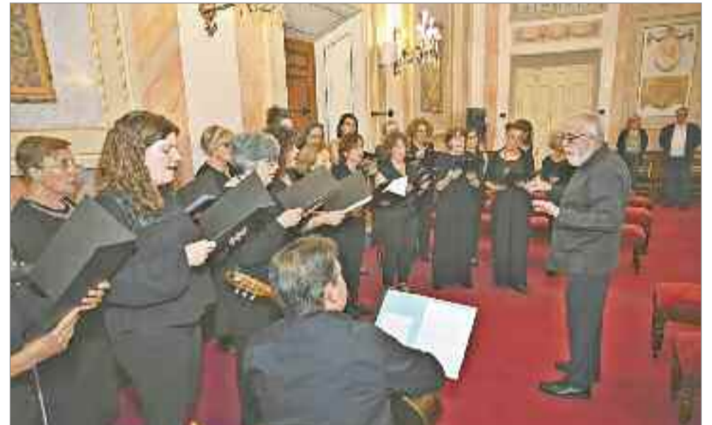
Tras el acto de entrega tuvo lugar la actuación del coro de voces femeninas Nuba.