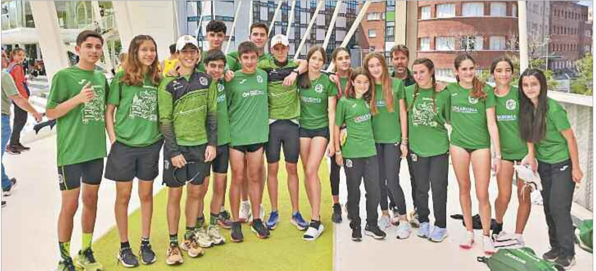
Las alcaláinas logran la victoria y el equipo masculino logra el 5º puesto en la 2ª división nacional. Además, los atletas Sub 16 y 18 logran 7 medallas autonómicas y numerosas mínimas nacionales.