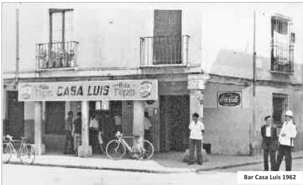
Bar Casa Luis 1962

La Peña el Garrote es, probablemente, la peña más antigua de nuestra ciudad. En sus comienzos en los años 60, fue una agrupación deportiva con un equipo de fútbol surgida de la iniciativa de un grupo de jóvenes en torno al bar Casa Luis, situado en la esquina de la plaza de los Santos Niños, plaza de Abajo, con la calle Escritorios. En aquella época, otros bares como el Coímbra, calle Mayor, o Bodegas Criado, plaza Santa María la Rica, tenían sus equipos de fútbol, jugando partidos entre ellos. Posteriormente, en 1980, se dio a la Peña un aspecto cultural estableciendo el galardón de Complutense del Año. En una reunión celebrada cada 28 de diciembre - sin buscar a esta fecha fáciles interpretaciones- los miembros de la peña eligen a la persona destacada por su alcalaínismo y en