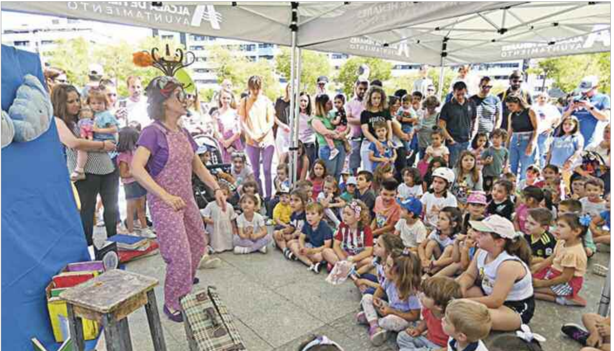
La Plaza del Viento se convirtió en el epicentro de los actos festivos, con juegos a lo grande, pasacalles, teatro infantil, talleres infantiles, una paellada vecinal, una gala de baile.