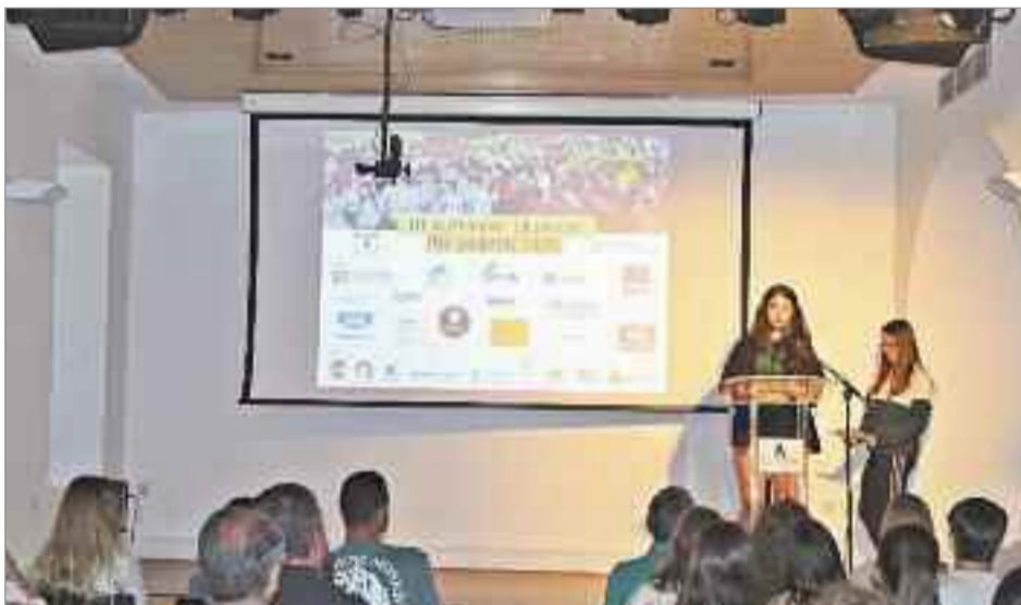
Gracias a este proyecto, una vez más Alcalá se convirtió en ciudad de Aprendizaje y Servicio.

Física y del Deporte de la UAH (CCAFYDE) fueron los encargados de transmitir los aprendizajes al alumnado de los IES Cardenal Cisneros y Alonso Quijano para que estos puedan organizar este evento y elaborar el dossier deportivo. "Alcalá Desarrollo", participó en esta III edición de las Olimpiadas Solidarias, transmitiendo al alumnado de 4º de la ESO del IES Complutense, los conocimientos necesarios para diseñar una estrategia adecuada para "vender" el proyecto a empresas, con el objetivo de conseguir colaboración por parte de nuestro ecosistema empresarial. El servicio consistió en llevar a cabo las