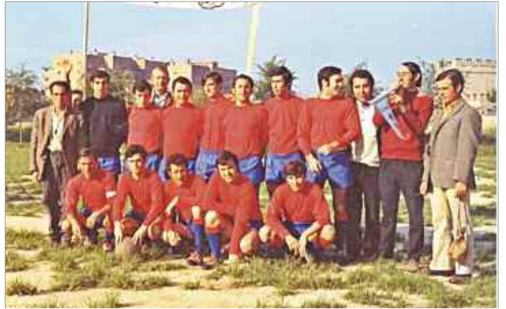
Equipo de fútbol de la Peña El Garrote en la huerta del obispo de Alcalá de Henares